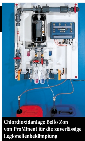
Chlordioxidanlage Bello Zon von ProMinent für die zuverlässige Legionellenbekämpfung

Nach der Trinkwasserverordnung (TWV) ist Chlordioxid (Bello Zon) als Desinfektionsmittel im Trinkwasser erlaubt (Konzentration 0,4 ppm). Nach vorliegenden Erfahrungen an verschiedenen Projekten im In- und Ausland ist diese